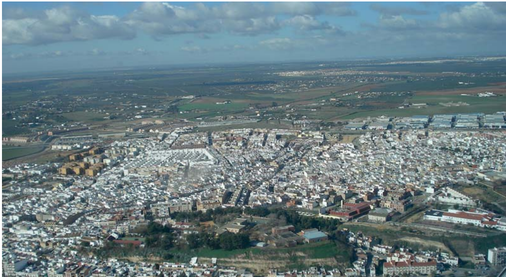
magen aérea de Coria del Río

Coria cuenta entre sus activos DEMOGRÁFICOS con una población relativamente joven con respecto a la media de la provincia y con una tasa de crecimiento vegetativo positiva. Por otro lado su localización, dentro del nuevo espacio metropolitano que abre la S-40, es un argumento atractor de población.