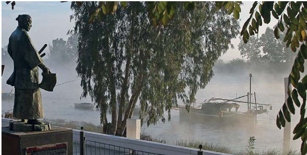
Homenaje a la expedición japonesa que llegó a Coria del Río a través del Guadalquivir

Los desafíos ECONÓMICOS que debe abordar Coria pasan por mejorar las sinergias entre los sectores productivos a nivel metropolitano, incentivar el emprendimiento y el autoempleo, mejorar las infraestructuras que permitan ganar competitividad y fortalecer el tejido empresarial.