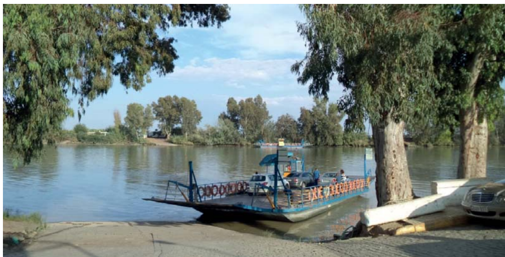
Barcaza una Coría del Río con Dos Hermanas a través del río Guadalquivir evitando la circunvalación SE-30

Los principales problemas CLIMÁTICOS que enfrenta Coria pasan por el excesivo uso del vehículo privado que llega a generar hasta la mitad de las emisiones de CO2 del municipio, la dependencia de la energía eléctrica y la escasa implantación de las energías renovables.