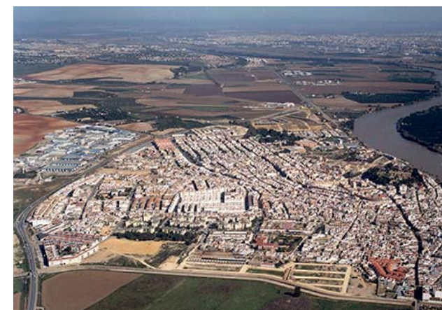
Imagen aérea de Coria del Río