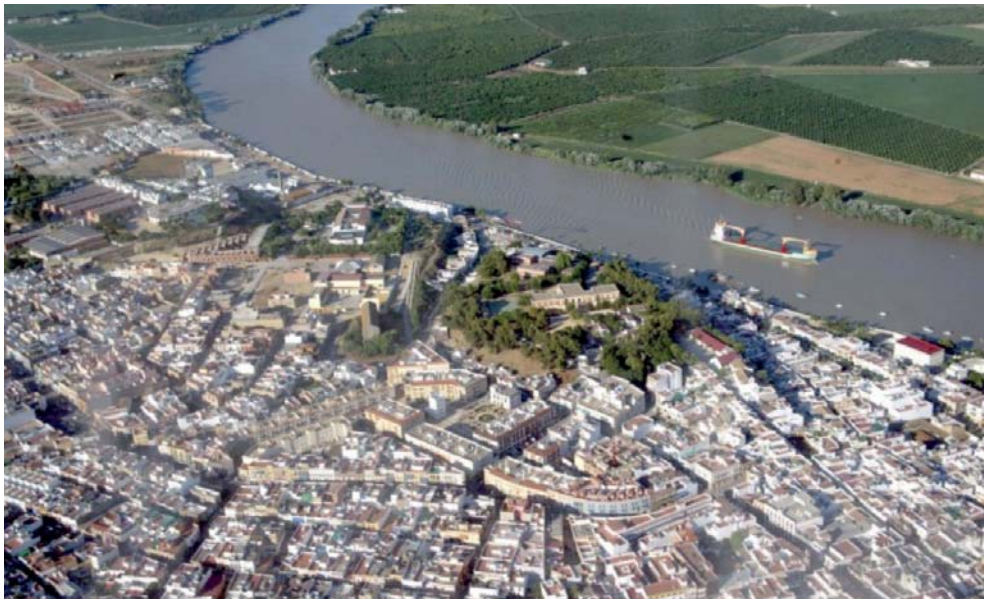
magen aérea de Coria del Río y el río Guadalquivir

Los principales problemas MEDIOAMBIENTALES pasan por la degradación que ha venido sufriendo el espacio urbano, especialmente el espacio del escarpe o cerro, que presenta además problemas de erosión y desprendimientos.