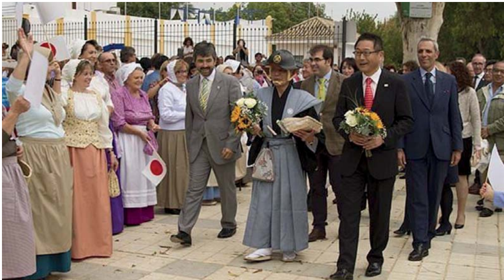
17. Conmemoración del hermanamiento entre Coria del Río y Japón

Los desafíos SOCIALES están ligados a la mejora de la empleabilidad de la población más vulnerable y su acceso a un empleo más estable y de mejor calidad; la promoción de iniciativas emprendedoras y autoempleo; la rehabilitación urbana de espacios en áreas vulnerables y la mejora de la accesibilidad a los servicios públicos.