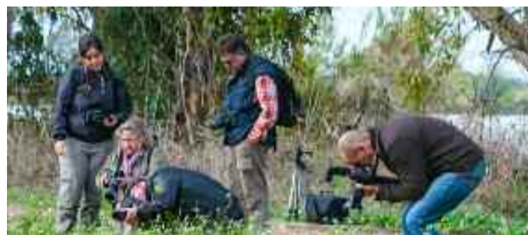
Participantes en la quedada fotográfica para amantes de la naturaleza.