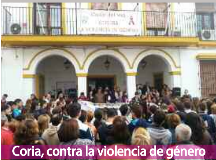
Coria, contra la violencia de género