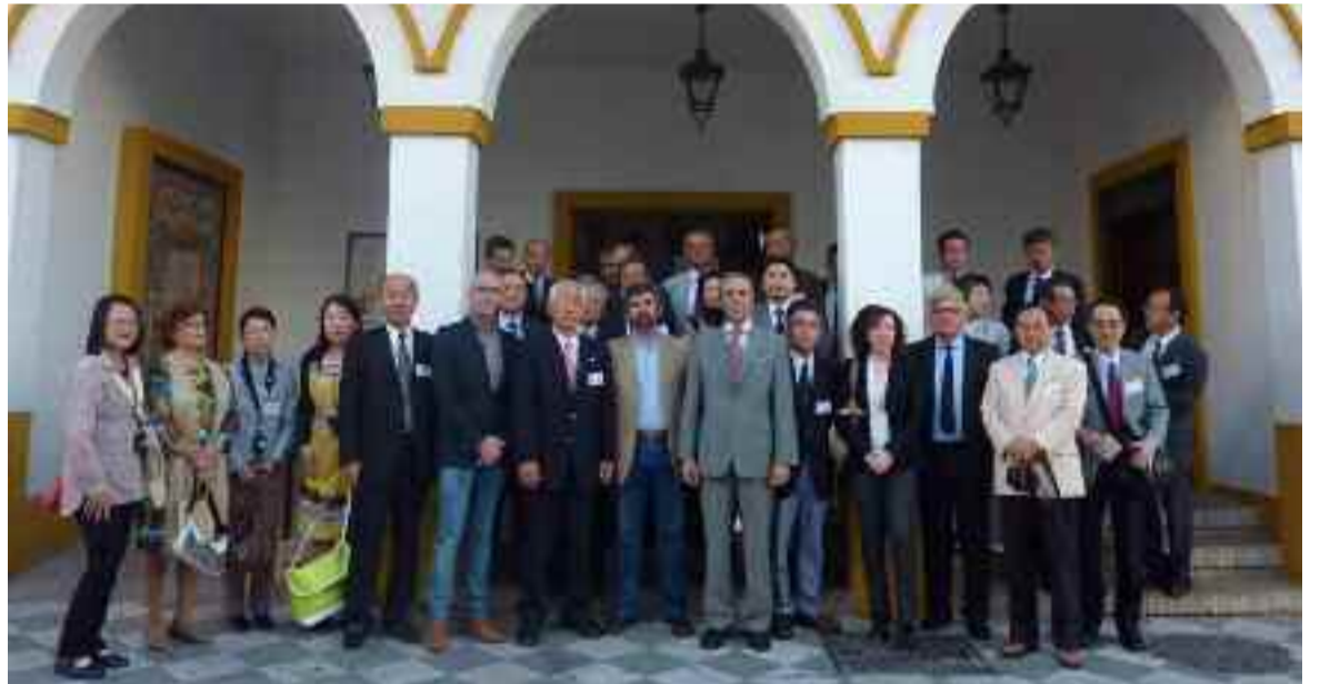
Representantes del Gobierno local y empresarios corianos junto a emisarios nipones, a las puertas del Ayuntamiento.

· El evento #HootupCoria sirvió además, a través de un curso gratuito, para que pymes y profesionales gestionen de un modo más eficiente las redes sociales.