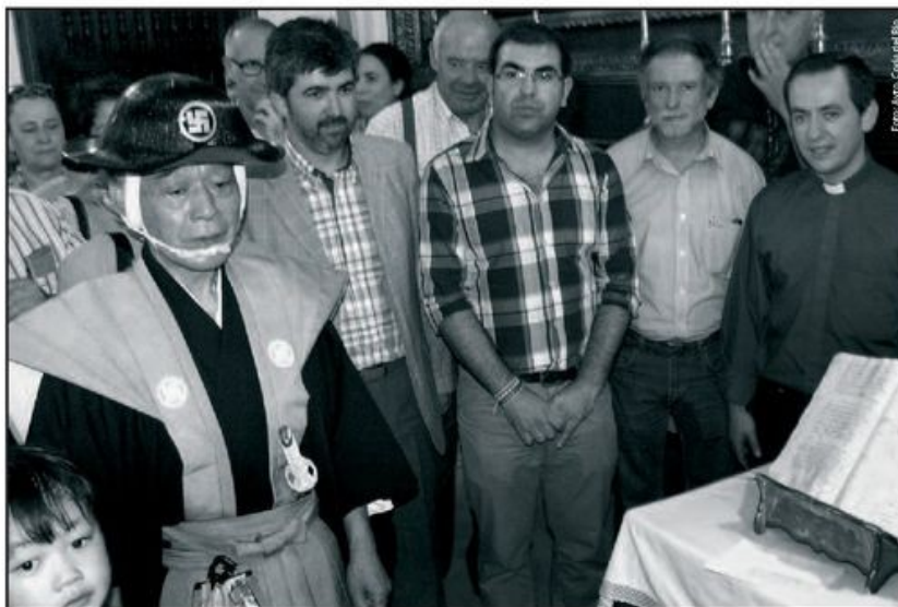
Hasekura Tsunetaka en la iglesia de La Estrella ante el registro bautismal en el que aparece el primer apellido Japón.

escribieron haiku en homenaje a las víctimas del terremoto y tsunamis de 11 de marzo de 2011.