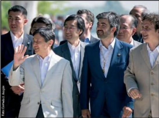
Naruhito saludando a los corianos congregados en el paseo del río.