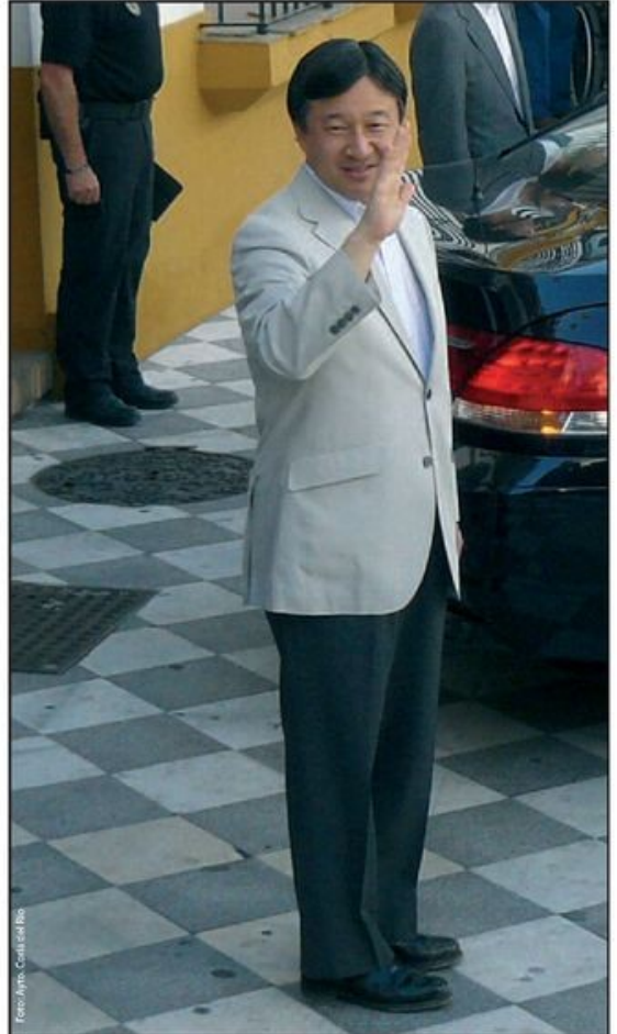
Naruhito saludando a los corianos en la puerta del Ayuntamiento.