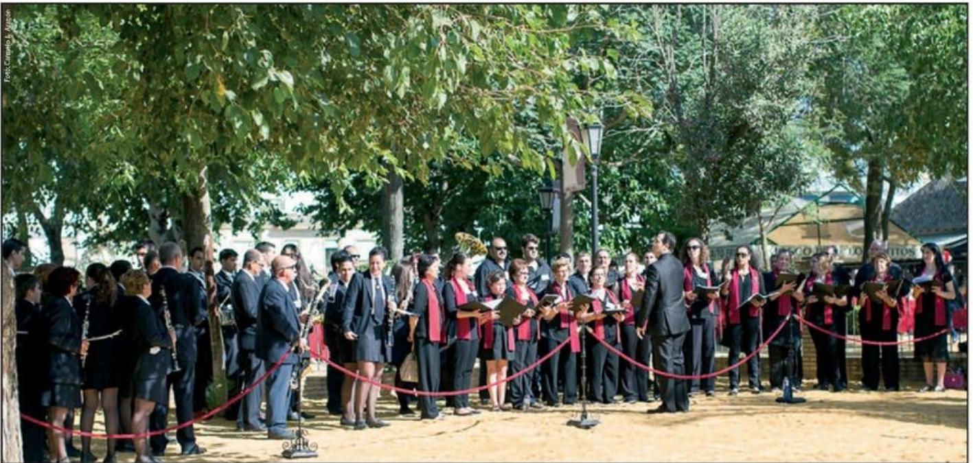
La Banda Municipal de Coria del Río y la Agrupación Musical Santa María de La Estrella que interpretaron los himnos oficiales de Japón, Andalucía y España.