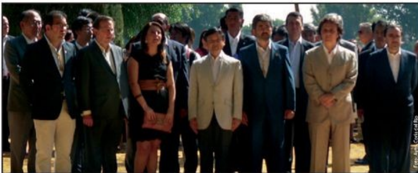
El príncipe japonés junto a las autoridades asistentes al acto en el Parque Carlos Mesa de Coria del Rio.