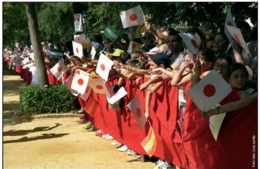
Los niños de Coria del Rio llenaron el Parque Carlos Mesa para recibir a Naruhito.