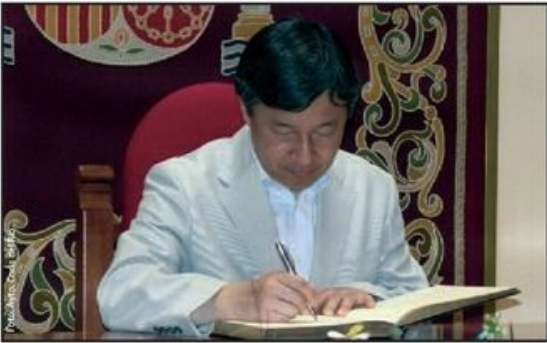
El heredero japonés firmando en el Libro de Honor de Coria del Río.