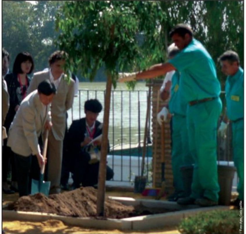
El Príncipe Naruhito sembrando el sakura (cerezo) junto a la estatua del samurai Hasekura Tsunenaga.