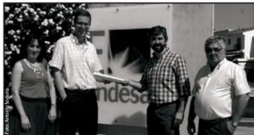
Representantes municipales y responsables de Endesa en la sede de ésta.

Desde el Ayuntamiento hemos hecho nuestro trabajo facilitando a través de la OMIC una vía de canalización de las reclamaciones, ahora esperamos una respuesta pronta de Endesa para paliar los daños causados por el