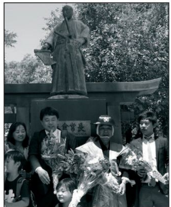
La familia de Hasekura Tsunetaka ante la estatua de su antepasado samurai.