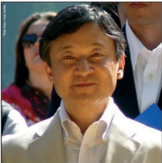
Naruhito, Príncipe Heredero de Japón, en Coria del Rio.