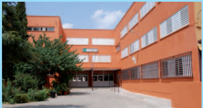
Pintado exterior del CEIP Manuel Gómez

Todos los colegios públicos del municipio reciben inversiones para la modernización y mejora de sus instalaciones.