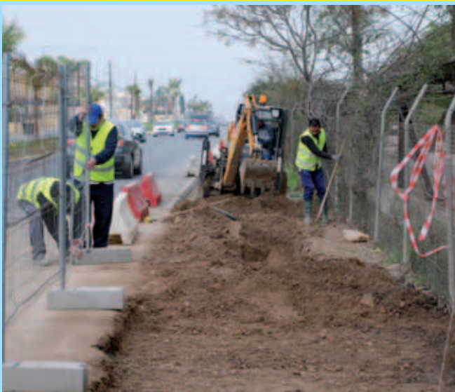
El Ayuntamiento acomete nuevas obras de mejora y embellecimiento de las entradas a Coria por Bda. Guadalquivir