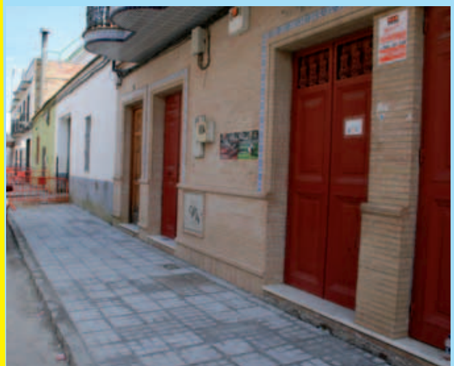
Obras de reforma y mejoras de Acerados en C/ Guadalquivir (Barrio de la Soledad)