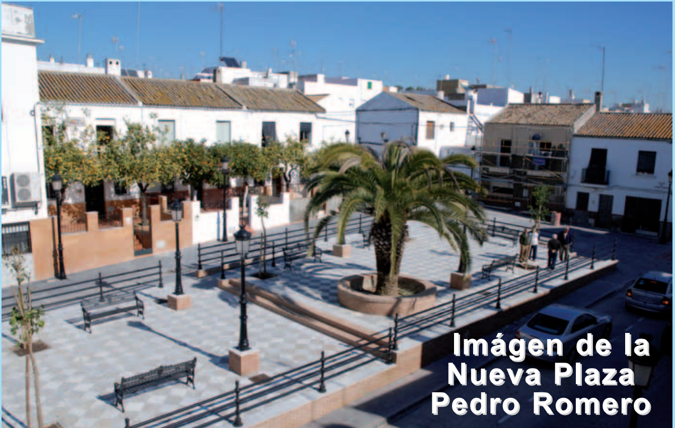
Imágen de la Nueva Plaza Pedro Romero