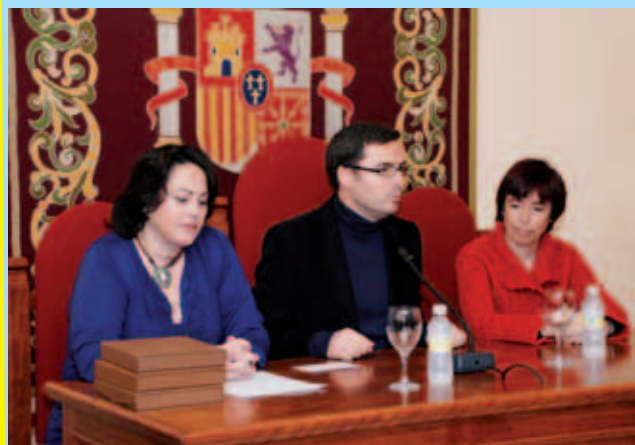
El Ayuntamiento celebra el Día Internacional de la Mujer. Entrega de los Premios del III Certámen de Relato Corto