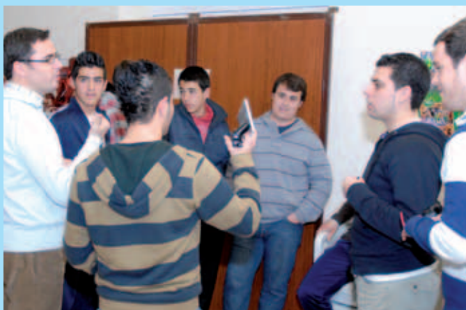
El Alcalde inaugura la 2ª Party Play donde participaron más de 100 jóvenes de la localidad