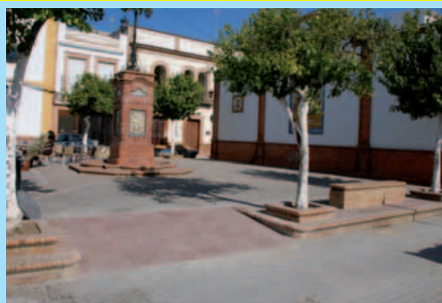
Contrucción de nuevos acerados y eliminación de barreras arquitectónicas en Plaza del Rocío y C/ Altozano